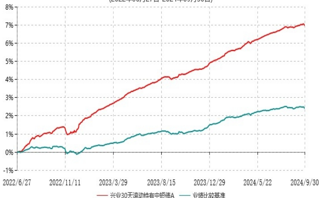
兴业30天滚动持有中短债A累计净值增长率与业绩比较基准收益率历史走势对比图 (2022年06月27日-2024年09月30日)