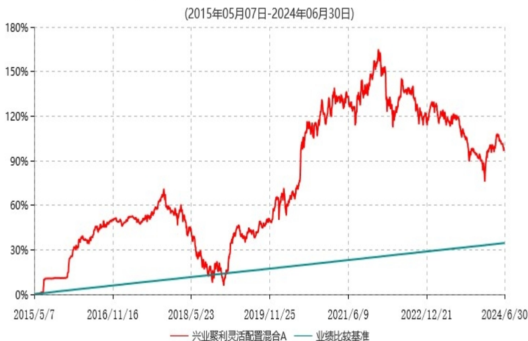
兴业聚利灵活配置混合A累计净值增长率与业绩比较基准收益率历史走势对比图