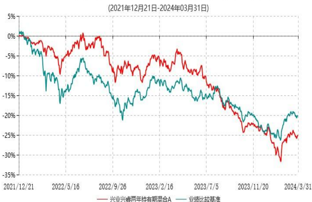
兴业兴睿两年持有期混合A累计净值增长率与业绩比较基准收益率历史走势对比图