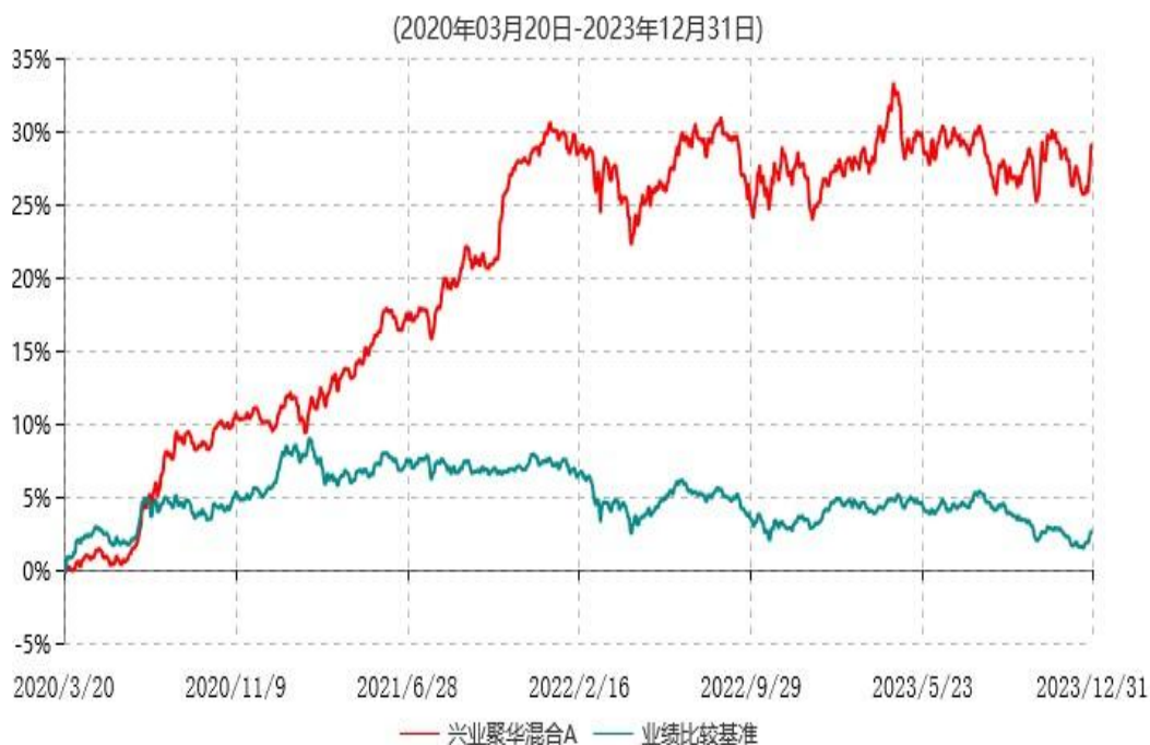
兴业聚华混合A累计净值增长率与业绩比较基准收益率历史走势对比图