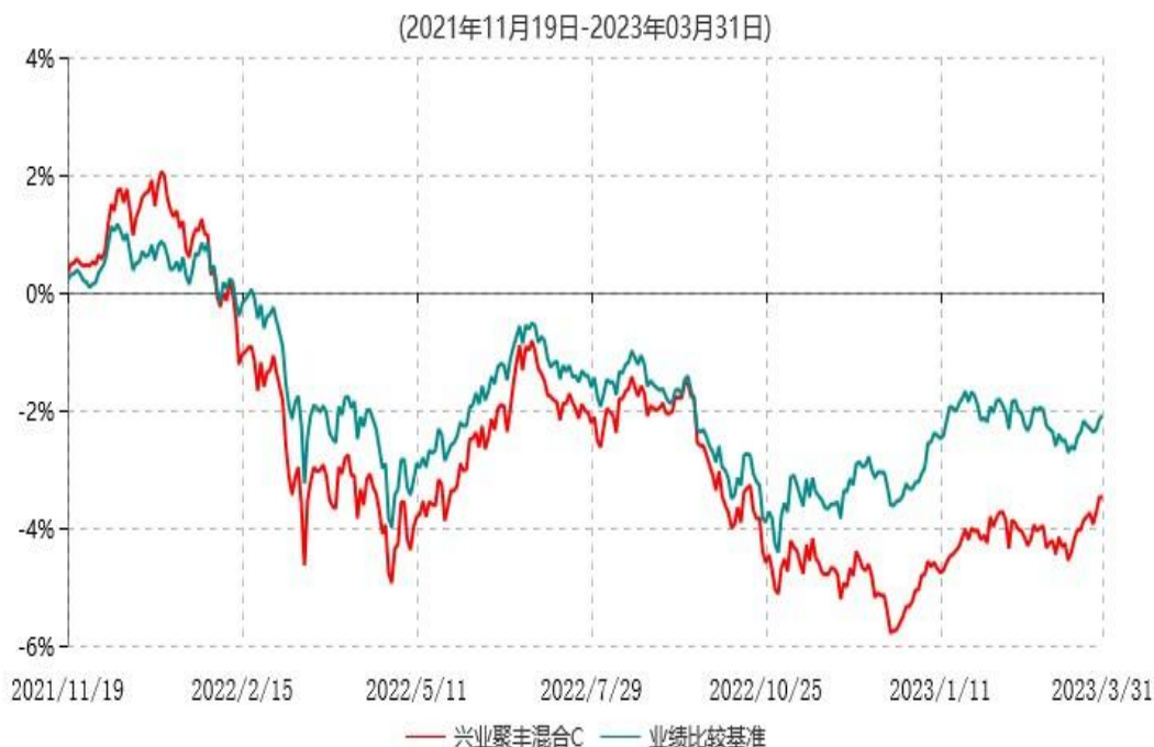
兴业聚丰混合C累计净值增长率与业绩比较基准收益率历史走势对比图

注：1、本基金基金合同于 2021 年 10 月 13 日生效，根据本基金基金合同规定，本基金自基金合同生效之日起六个月内已使基金的投资组合比例符合基金合同的约定。 2、本基金合同自 2021 年 10 月 13 日起生效并增设 C 类份额，自 2021 年 11 月 19 日起 C 类份额存续。