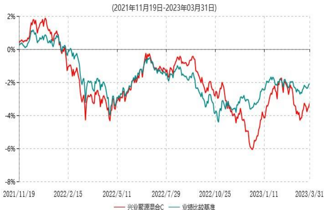
兴业聚源混合C累计净值增长率与业绩比较基准收益率历史走势对比图

注：1、本基金基金合同于 2021 年 10 月 13 日生效，根据本基金基金合同规定，本基金自基金合同生效之日起六个月内已使基金的投资组合比例符合基金合同的约定。 2、本基金合同自 2021 年 10 月 13 日起生效并增设 C 类份额，自 2021 年 11 月 19 日起 C 类份额存续。