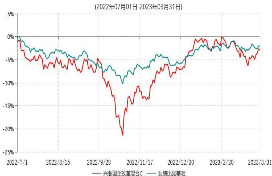
兴业国企改革混合C累计净值增长率与业绩比较基准收益率历史走势对比图

注：1、本基金基金合同于 2015 年 9 月 17 日生效，根据本基金基金合同规定，本基金自基金合同生效之日起六个月内已使基金的投资组合比例符合基金合同的约定。 2、本基金自 2022 年 06 月 17 日起增设 C 类份额，自 2022 年 07 月 01 日起 C 类份额存续，上述业绩表现按实际存续期计算。