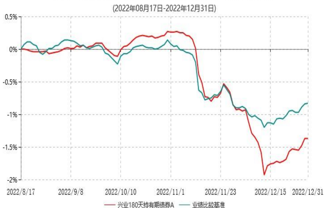
兴业180天持有期债券A累计净值增长率与业绩比较基准收益率历史走势对比图