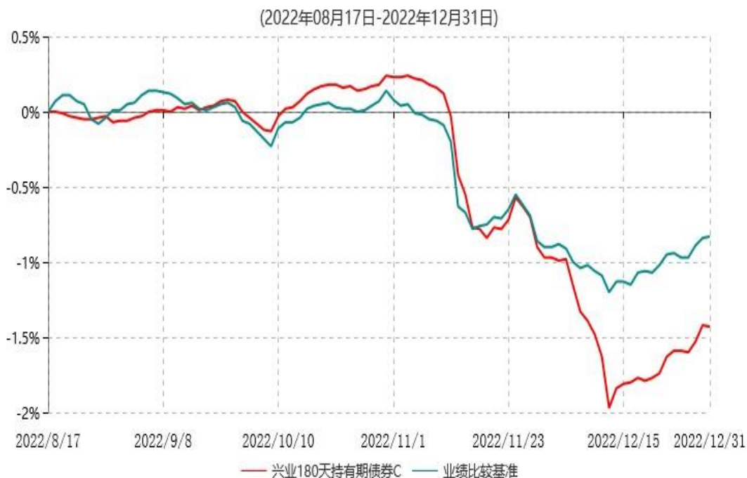
兴业180天持有期债券C累计净值增长率与业绩比较基准收益率历史走势对比图