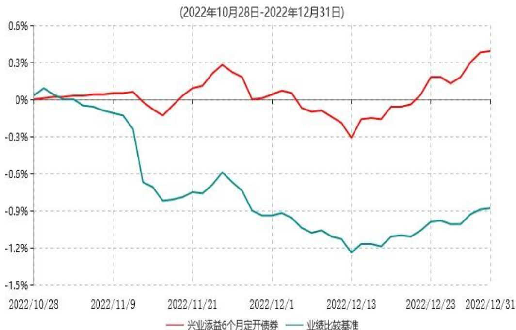
兴业添益6个月定期开放债券型证券投资基金累计净值增长率与业绩比较基准收益率历史走势对比图

注：1、本基金基金合同于2022年10月28日生效，截至报告期末本基金基金合同生效未 满一年。