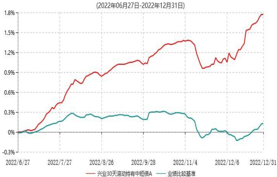
兴业30天滚动持有中短债A累计净值增长率与业绩比较基准收益率历史走势对比图