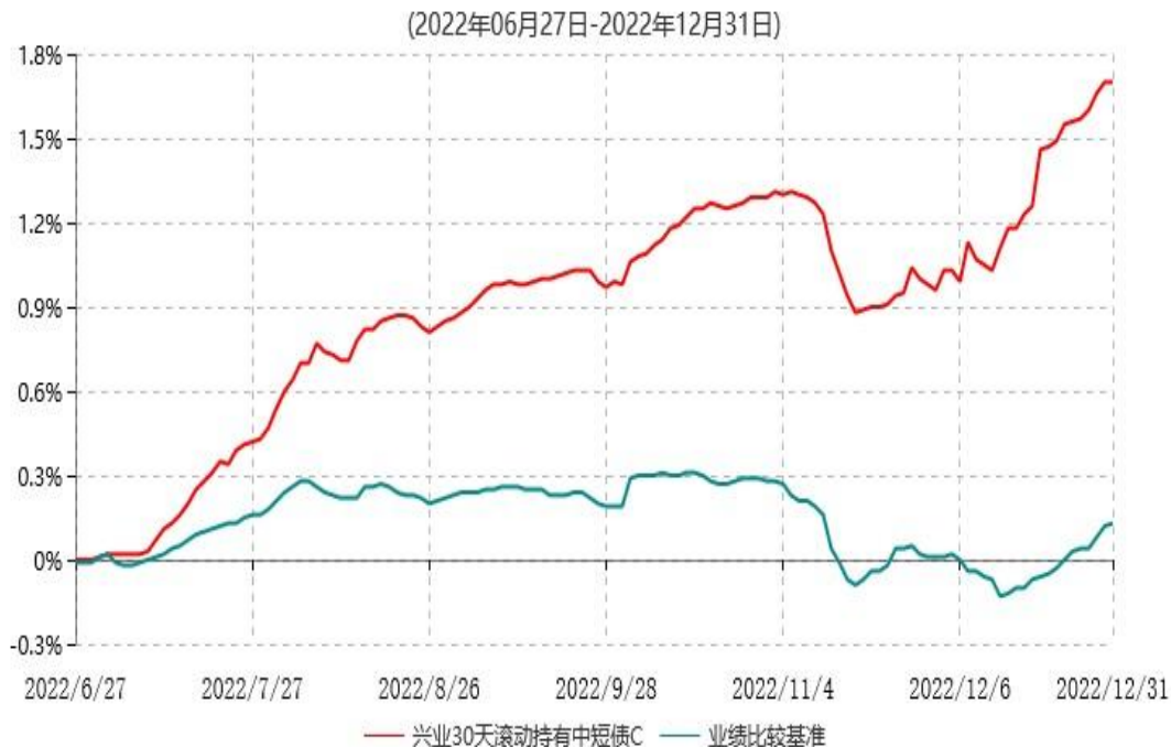
兴业30天滚动持有中短债C累计净值增长率与业绩比较基准收益率历史走势对比图