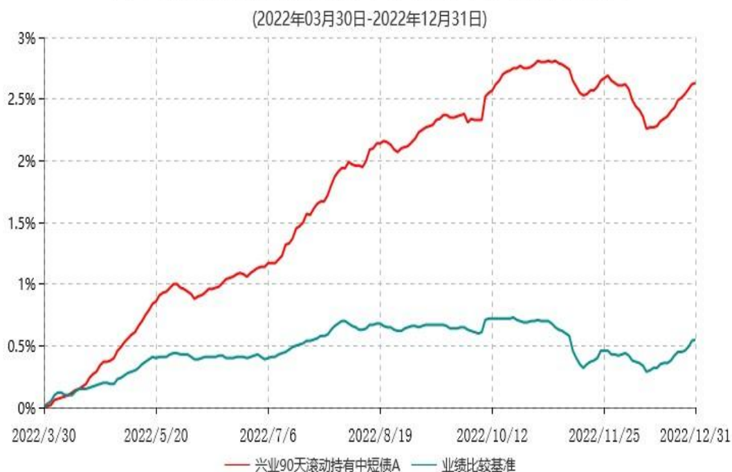
兴业90天滚动持有中短债A累计净值增长率与业绩比较基准收益率历史走势对比图