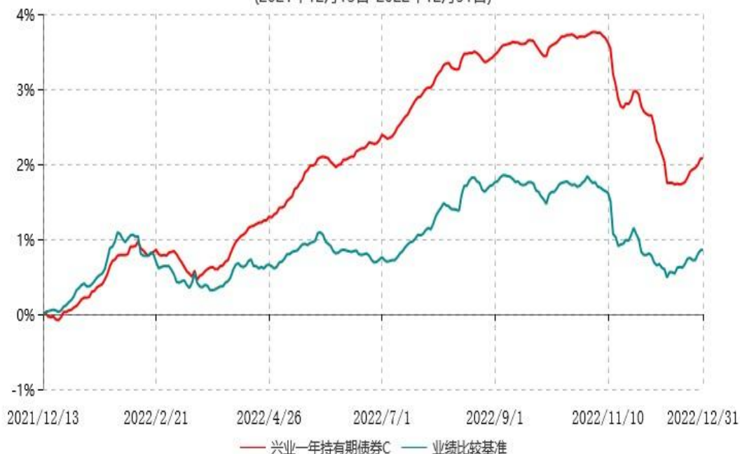
兴业一年持有期债券C累计净值增长率与业绩比较基准收益率历史走势对比图 (2021年12月13日-2022年12月31日)

本基金合同自2021年12月13日起生效，根据本基金合同规定，本基金自基金合同生效之日起6个月内已使基金的投资组合比例符合基金合同的有关约定。