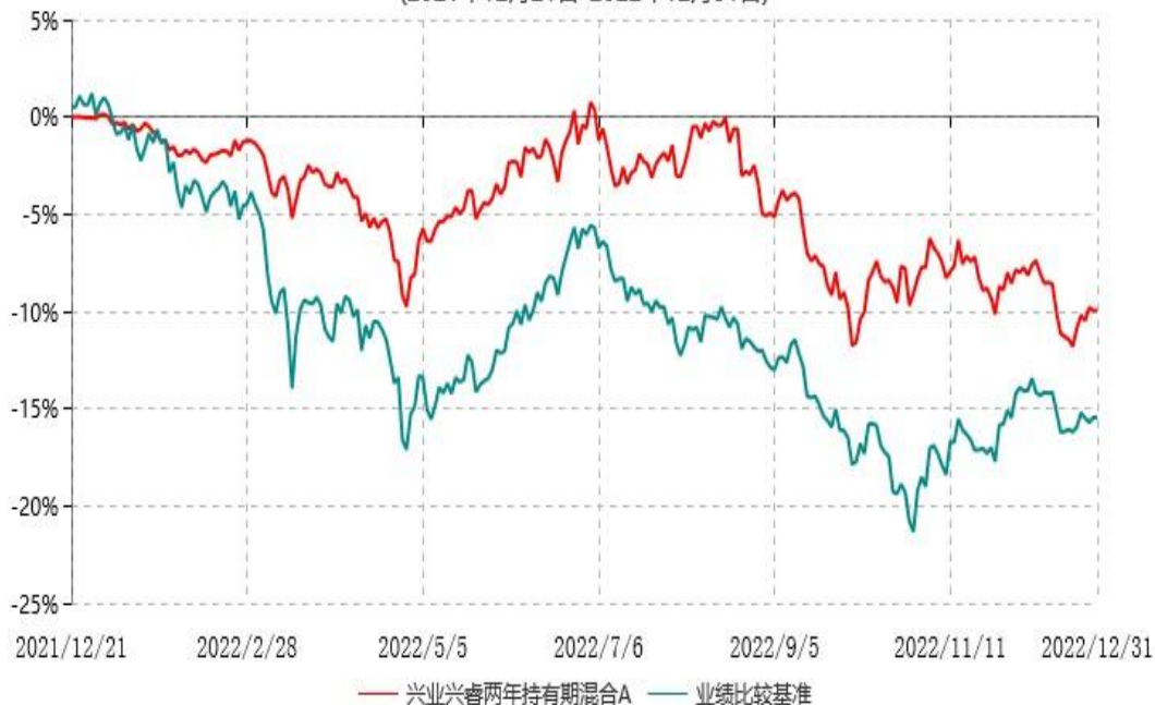
兴业兴睿两年持有期混合A累计净值增长率与业绩比较基准收益率历史走势对比图 (2021年12月21日-2022年12月31日)

注：本基金基金合同于2021年12月21日生效，本基金自基金合同生效之日起六个月内已使基金的投资组合比例符合基金合同的约定。