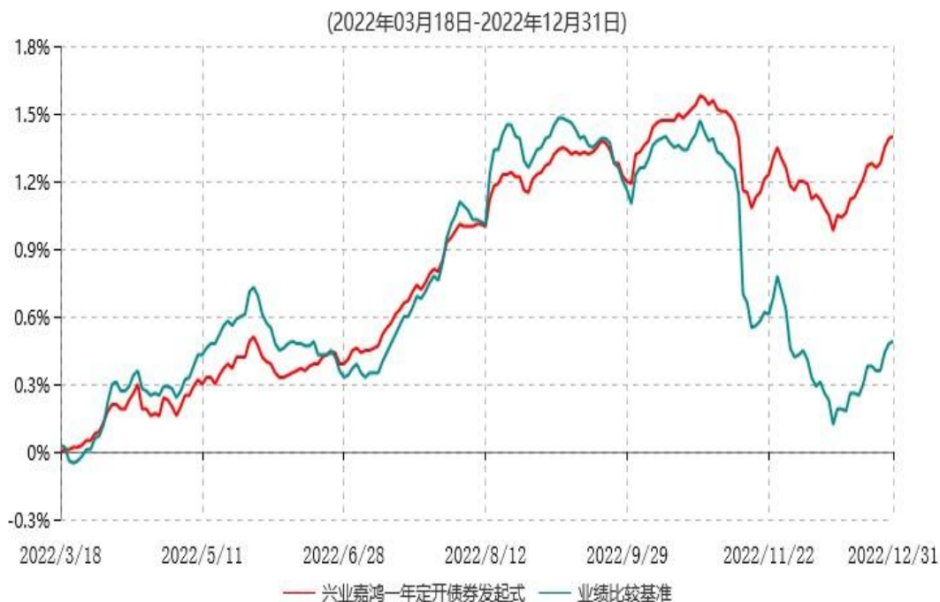
兴业嘉鸿一年定期开放债券型发起式证券投资基金累计净值增长率与业绩比较基准收益率历史走势对比图

注：1、本基金基金合同于2022年03月18日生效，截至本报告期末本基金基金合同生效未满一年。