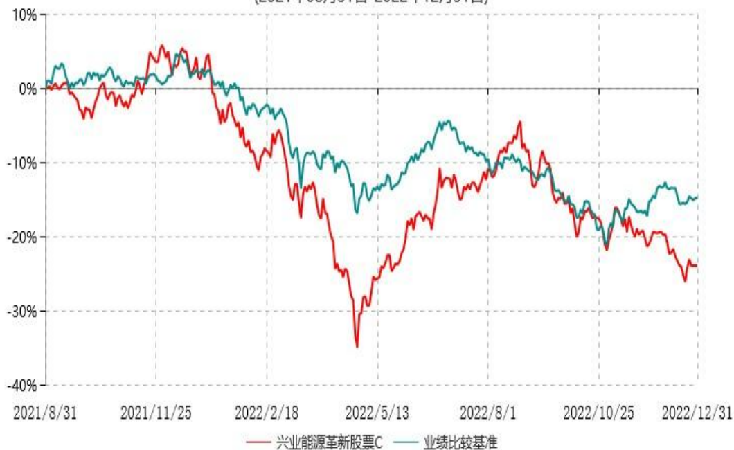
兴业能源革新股票C累计净值增长率与业绩比较基准收益率历史走势对比图 (2021年08月31日-2022年12月31日)

注：本基金基金合同于2021年08月31日生效，根据本基金基金合同规定，本基金自基金合同生效之日起六个月内已使基金的投资组合比例符合基金合同的约定。