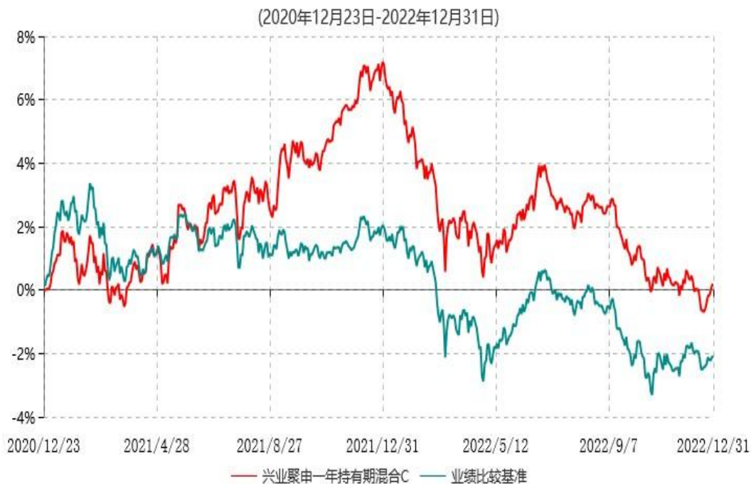
兴业聚申一年持有期混合C累计净值增长率与业绩比较基准收益率历史走势对比图

注：本基金基金合同于2020年12月23日生效，根据本基金基金合同规定，基金管理人自基金合同生效之日起6个月内已使基金的投资组合比例符合基金合同的有关约定。