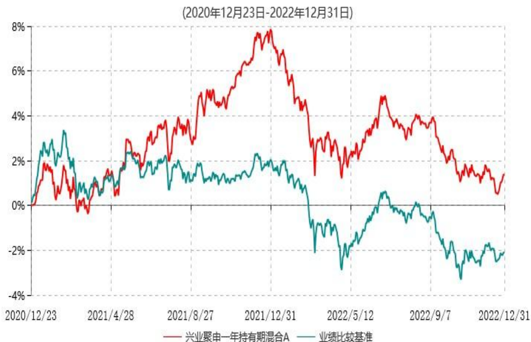
兴业聚申一年持有期混合A累计净值增长率与业绩比较基准收益率历史走势对比图

注：本基金基金合同于2020年12月23日生效，根据本基金基金合同规定，基金管理人自基金合同生效之日起6个月内已使基金的投资组合比例符合基金合同的有关约定。