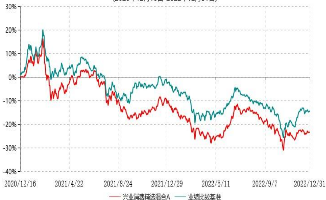
兴业消费精选混合C累计净值增长率与业绩比较基准收益率历史走势对比图