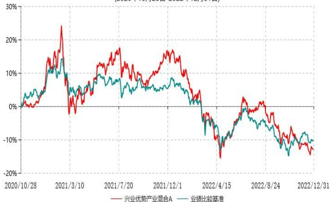
兴业优势产业混合C累计净值增长率与业绩比较基准收益率历史走势对比图