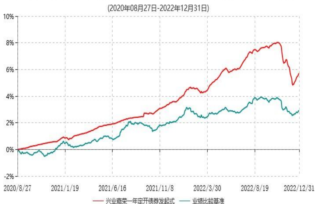
兴业嘉荣一年定期开放债券型发起式证券投资基金累计净值增长率与业绩比较基准收益率历史走势对比图

注：根据本基金基金合同规定，基金管理人自基金合同生效之日起6个月内已使基金的投资组合比例符合基金合同的有关规定。