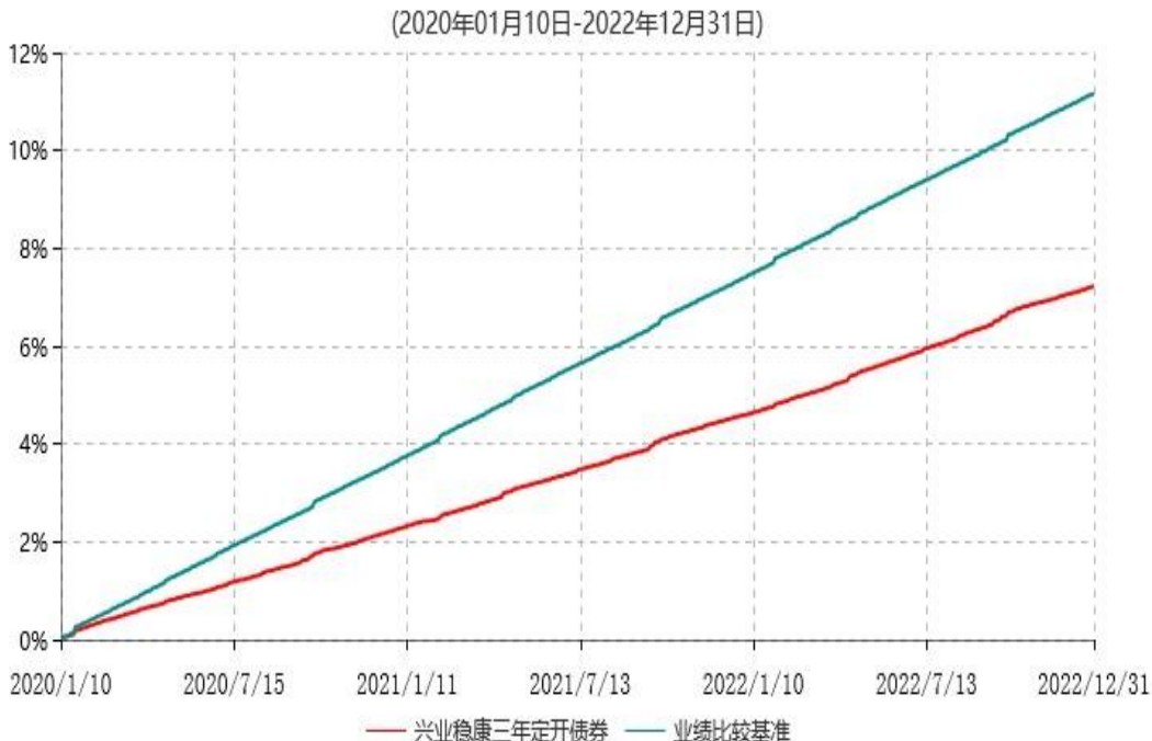
兴业稳康三年定期开放债券型证券投资基金累计净值增长率与业绩比较基准收益率历史走势对比图