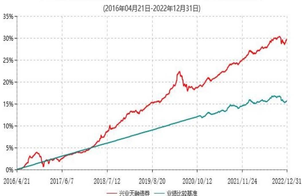
兴业天融债券型证券投资基金累计净值增长率与业绩比较基准收益率历史走势对比图

注：本基金的业绩比较基准自2020年11月4日起变更为：中国债券综合全价指数收益率。