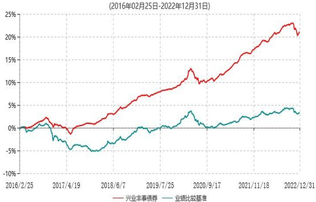
兴业丰泰债券型证券投资基金累计净值增长率与业绩比较基准收益率历史走势对比图