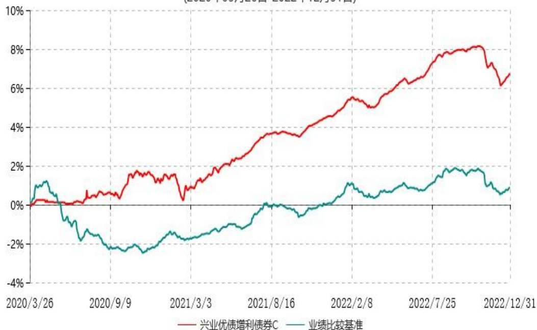
兴业优债增利债券C累计净值增长率与业绩比较基准收益率历史走势对比图 (2020年03月26日-2022年12月31日)

本基金合同自2020年3月24日起生效并增设C类份额，自2020年3月26日起C类份额存续。上述业绩表现按实际存续期计算。