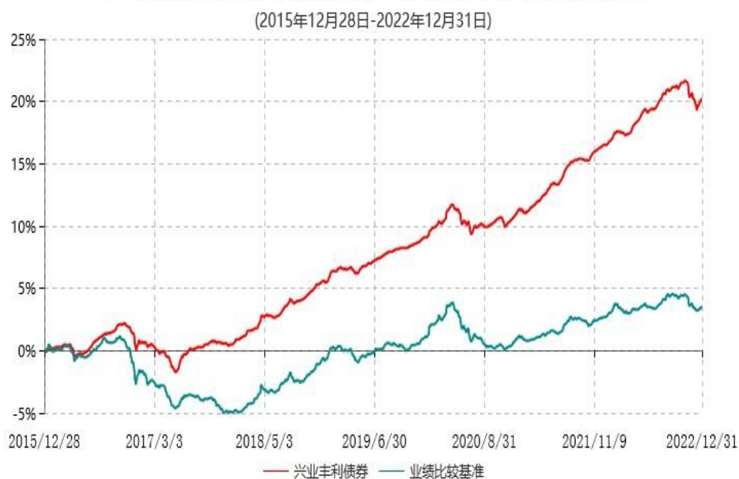
兴业丰利债券型证券投资基金累计净值增长率与业绩比较基准收益率历史走势对比图