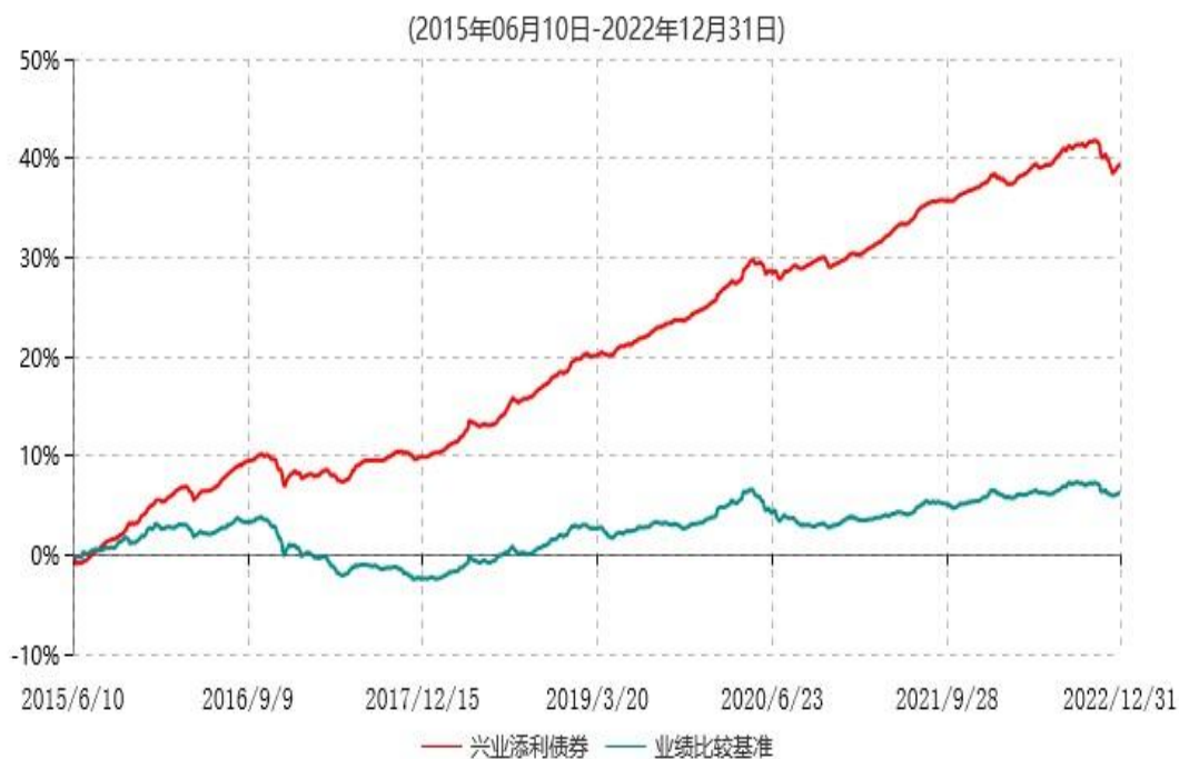
兴业添利债券型证券投资基金累计净值增长率与业绩比较基准收益率历史走势对比图