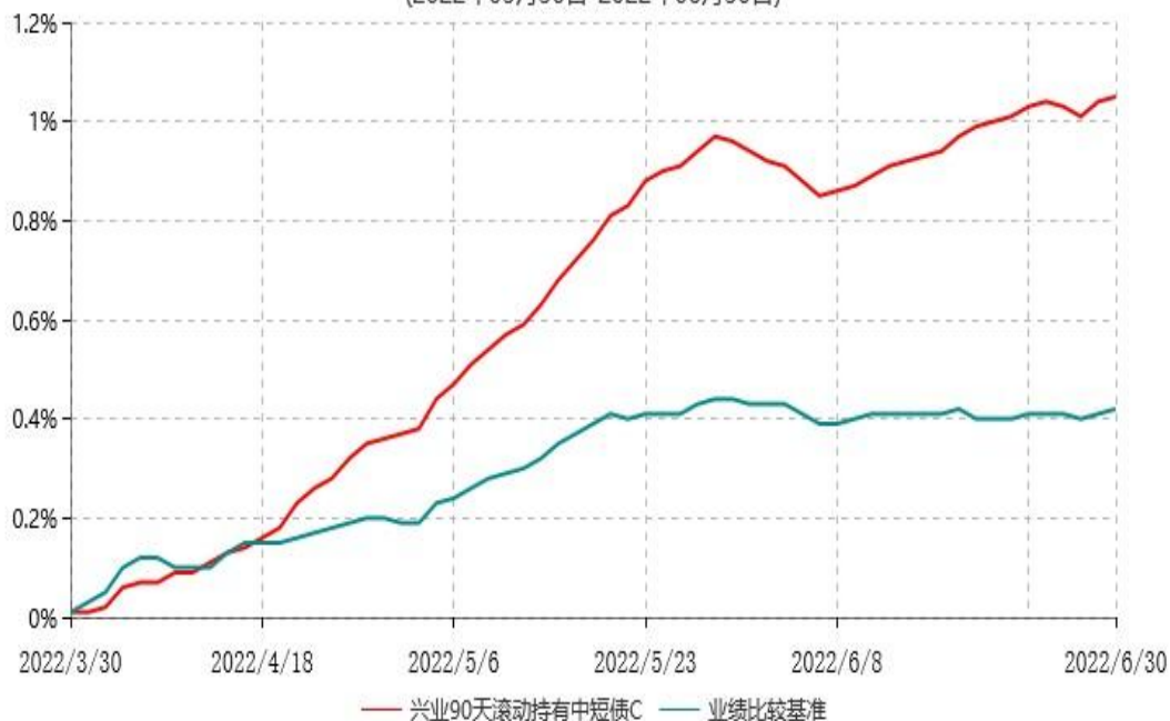
兴业90天滚动持有中短债C累计净值增长率与业绩比较基准收益率历史走势对比图 (2022年03月30日-2022年06月30日)

2、根据本基金基金合同规定，基金管理人应当自基金合同生效之日起6个月内使基金的投资组合比例符合基金合同的有关约定。截止本报告期末本基金仍处于建仓期。