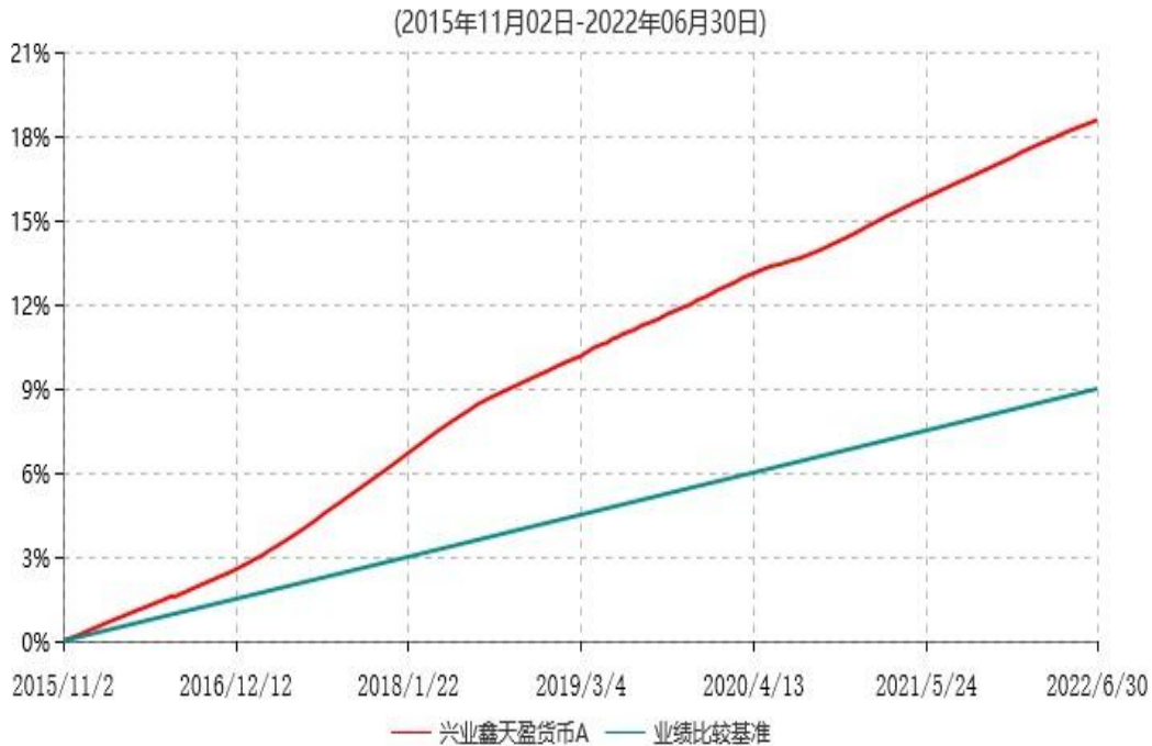
兴业鑫天盈货币A累计净值收益率与业绩比较基准收益率历史走势对比图