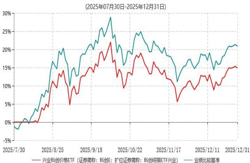
兴业上证科创板综合价格交易型开放式指数证券投资基金累计净值增长率与业绩比较基准收益率历史走势对比图

注：1、本基金基金合同于2025年7月30日生效，截至报告期末本基金基金合同生效未满一年。