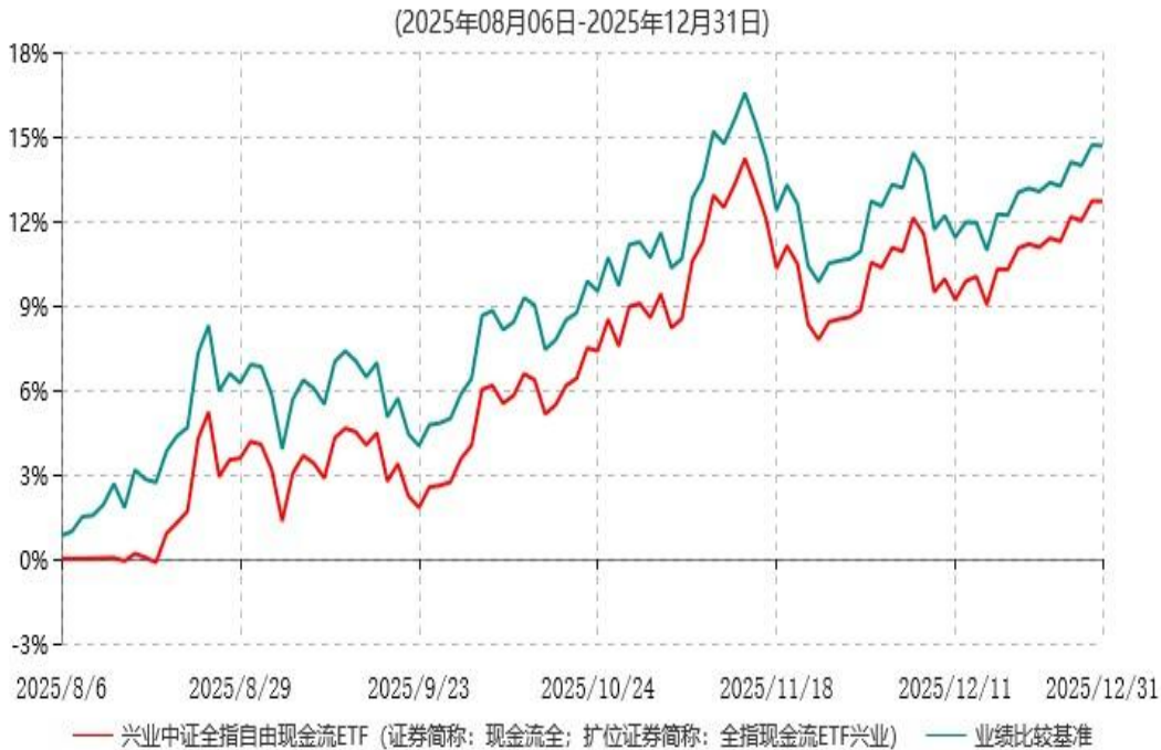
兴业中证全指自由现金流交易型开放式指数证券投资基金累计净值增长率与业绩比较基准收益率历史走势对比图

注：1、本基金基金合同于2025年08月06日生效，截至报告期末本基金基金合同生效未 满一年。