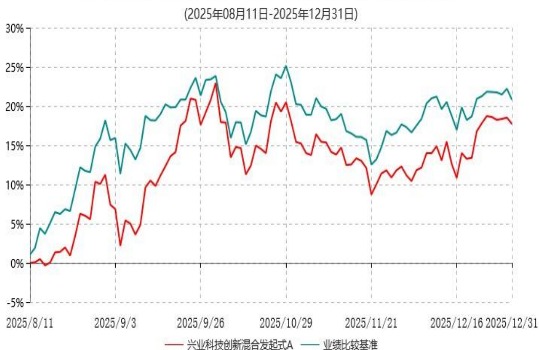
兴业科技创新混合发起式A累计净值增长率与业绩比较基准收益率历史走势对比图

注：1、本基金基金合同于2025年08月11日生效，截至报告期末本基金基金合同生效未 满一年。