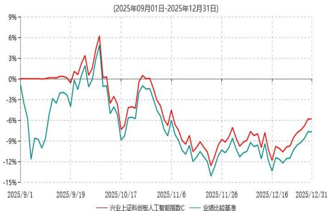
兴业上证科创板人工智能指数C累计净值增长率与业绩比较基准收益率历史走势对比图

2、根据本基金基金合同规定，基金管理人应当自基金合同生效之日起6个月内使基金的投资组合比例符合基金合同的有关约定。截止本报告期末本基金仍处于建仓期。