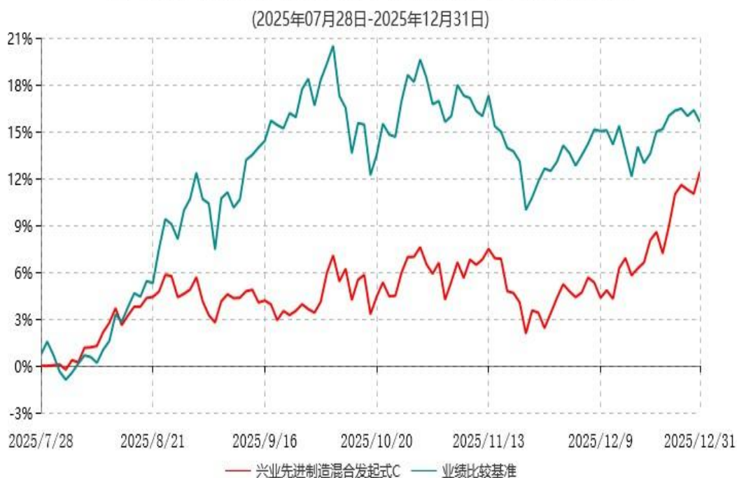
兴业先进制造混合发起式C累计净值增长率与业绩比较基准收益率历史走势对比图

2、根据本基金基金合同规定，基金管理人应当自基金合同生效之日起6个月内使基金的 投资组合比例符合基金合同的有关约定。截止本报告期末本基金仍处于建仓期。