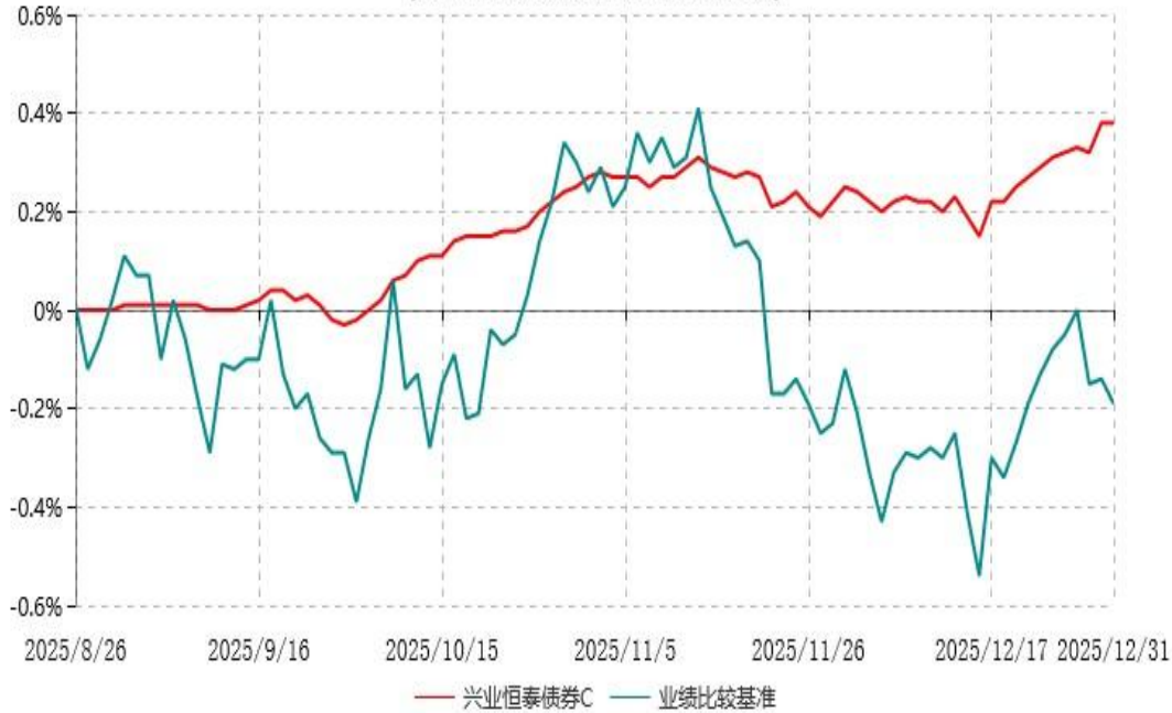
兴业恒泰债券C累计净值增长率与业绩比较基准收益率历史走势对比图 (2025年08月26日-2025年12月31日)

注：1、本基金基金合同于2025年8月26日生效，截至报告期末本基金基金合同生效未满一年。