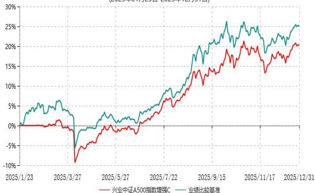
兴业中证A500指数增强C累计净值增长率与业绩比较基准收益率历史走势对比图 (2025年01月23日-2025年12月31日)