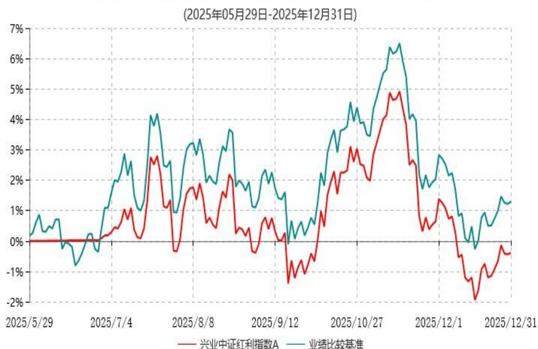
兴业中证红利指数A累计净值增长率与业绩比较基准收益率历史走势对比图