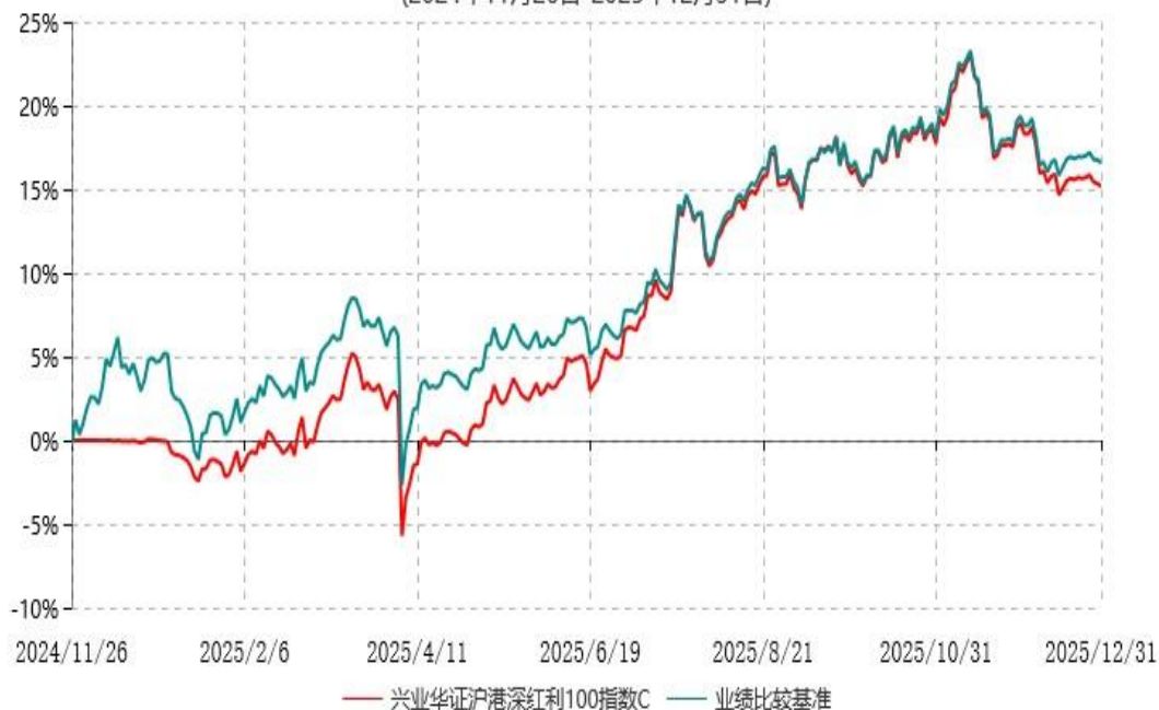
兴业华证沪港深红利100指数C累计净值增长率与业绩比较基准收益率历史走势对比图 (2024年11月26日-2025年12月31日)

本基金基金合同于2024年11月26日生效，根据本基金基金合同规定，本基金自基金合同生效之日起六个月内已使基金的投资组合比例符合基金合同的约定。