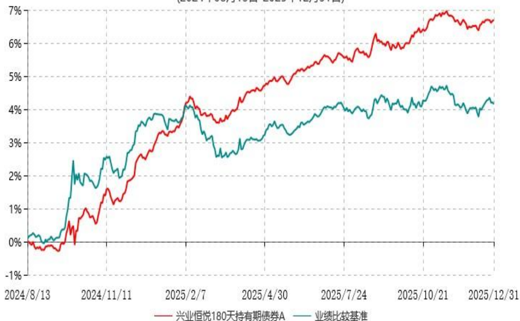
兴业恒悦180天持有期债券A累计净值增长率与业绩比较基准收益率历史走势对比图 (2024年08月13日-2025年12月31日)

注：根据本基金基金合同规定，基金管理人自基金合同生效之日起6个月内已使基金的投资组合比例符合基金合同的有关约定。