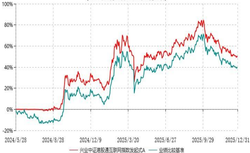
兴业中证港股通互联网指数发起式A累计净值增长率与业绩比较基准收益率历史走势对比图 (2024年05月28日-2025年12月31日)