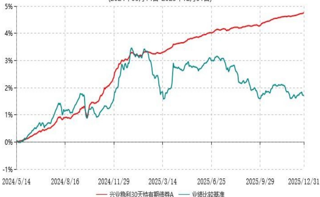
兴业稳利30天持有期债券A累计净值增长率与业绩比较基准收益率历史走势对比图 (2024年05月14日-2025年12月31日)

注：本基金基金合同于2024年5月14日生效，根据本基金基金合同规定，本基金自基金合同生效之日起六个月内已使基金的投资组合比例符合基金合同的约定。