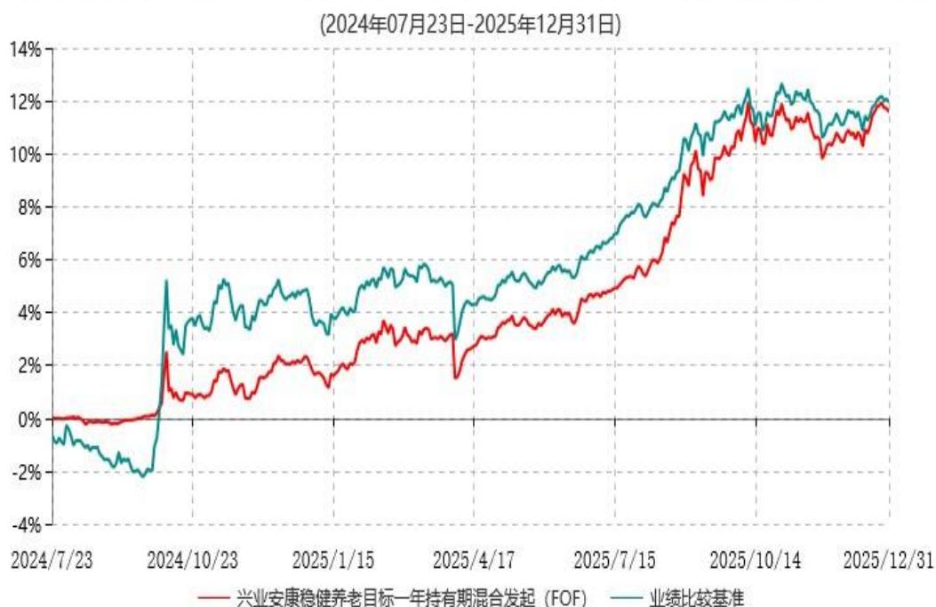
兴业安康稳健养老目标一年持有期混合型发起式基金中基金（FOF）累计净值增长率与业绩比较基准收益率历史走势对比图

注：根据本基金基金合同规定，本基金自基金合同生效之日起六个月内已使基金的投资组合比例符合基金合同的约定。