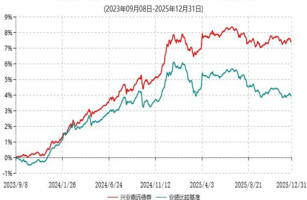
兴业嘉远债券型证券投资基金累计净值增长率与业绩比较基准收益率历史走势对比图