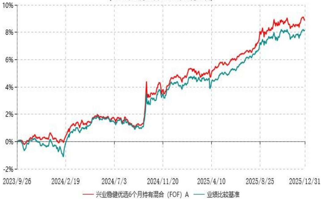
兴业稳健优选6个月持有混合（FOF）A累计净值增长率与业绩比较基准收益率历史走势对比图 (2023年09月26日-2025年12月31日)