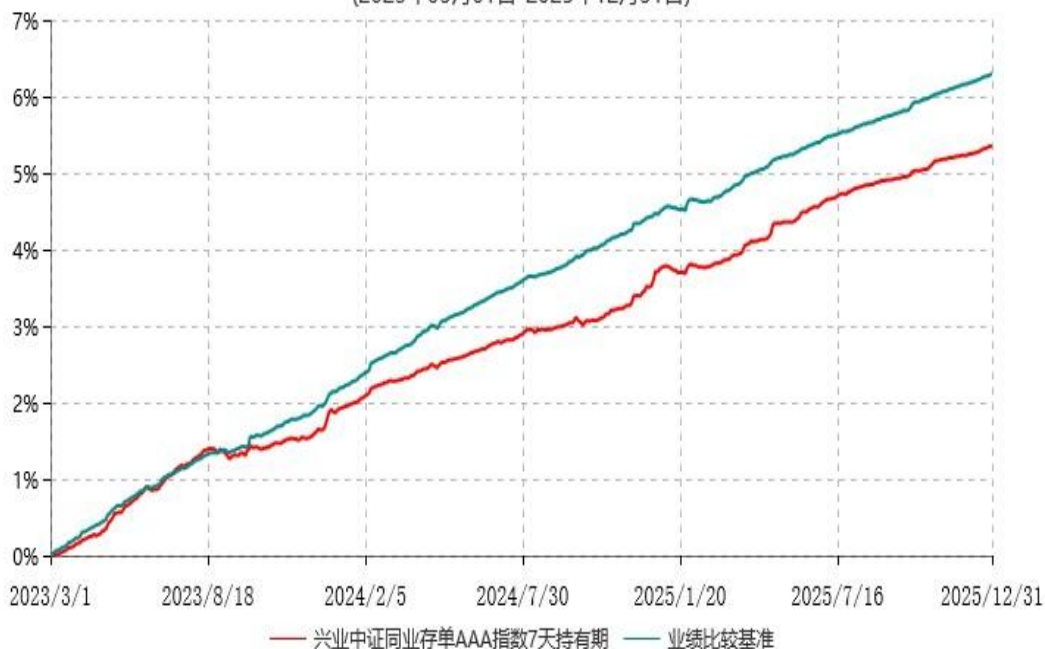
兴业中证同业存单AAA指数7天持有期证券投资基金累计净值增长率与业绩比较基准收益率历史走势对比图 (2023年03月01日-2025年12月31日)

注：根据本基金基金合同规定，本基金自基金合同生效之日起六个月内已使基金的投资组合比例符合基金合同的约定。