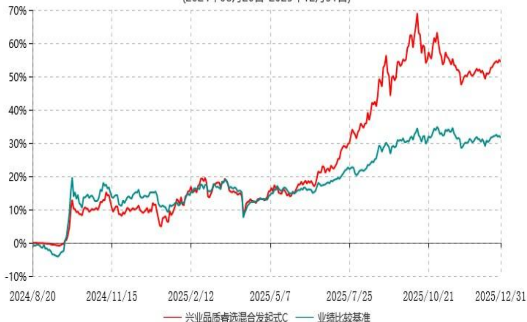
兴业品质睿选混合发起式C累计净值增长率与业绩比较基准收益率历史走势对比图 (2024年08月20日-2025年12月31日)

注：根据本基金基金合同规定，基金管理人自基金合同生效之日起6个月内已使基金的投资组合比例符合基金合同的有关约定。