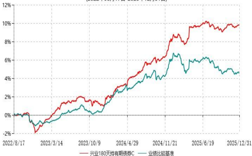
兴业180天持有期债券C累计净值增长率与业绩比较基准收益率历史走势对比图 (2022年08月17日-2025年12月31日)

根据本基金基金合同规定，本基金自基金合同生效之日起六个月内已使基金的投资组合比例符合基金合同的约定。