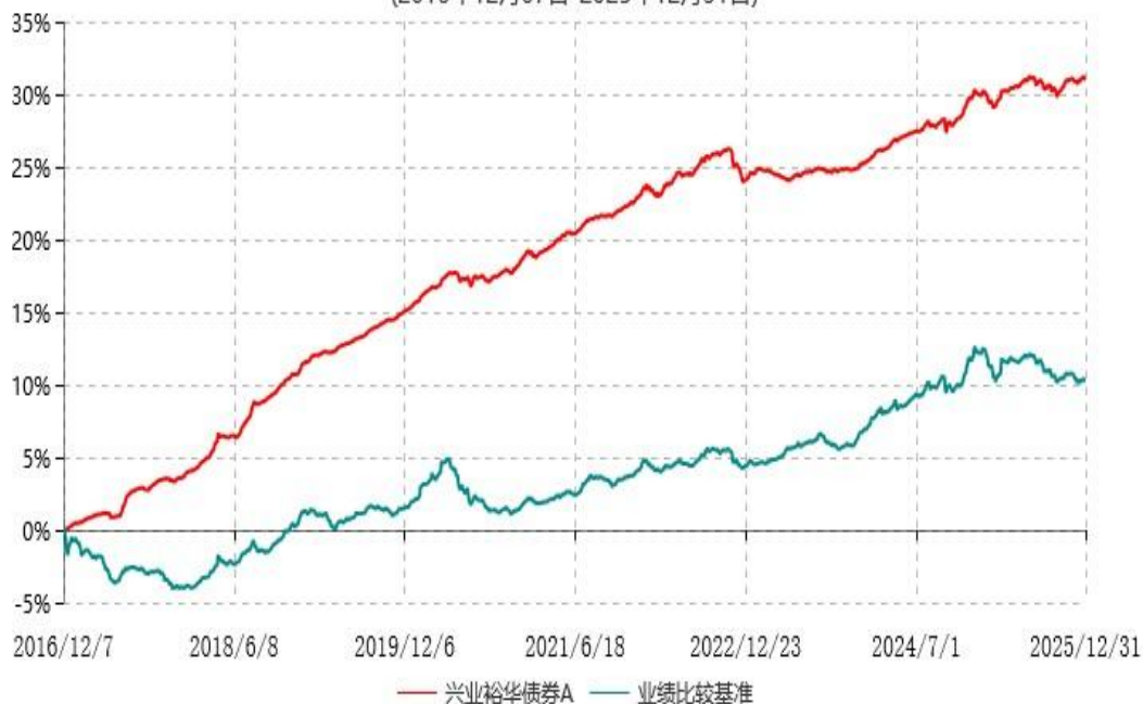
兴业裕华债券C累计净值增长率与业绩比较基准收益率历史走势对比图