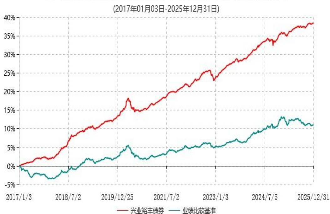
兴业裕丰债券型证券投资基金累计净值增长率与业绩比较基准收益率历史走势对比图