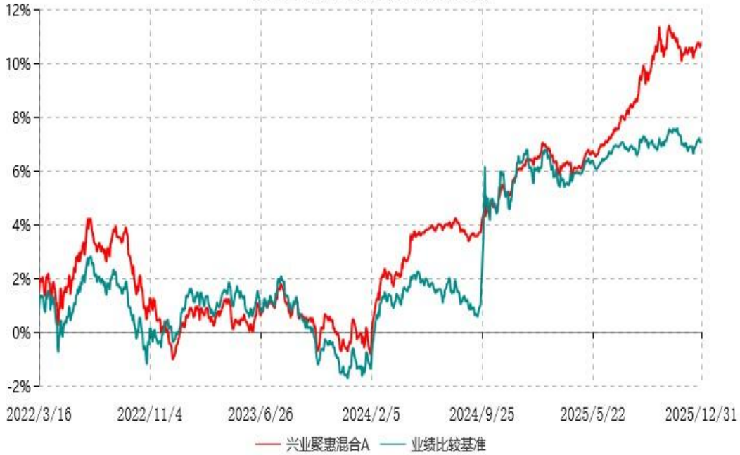
兴业聚惠混合C累计净值增长率与业绩比较基准收益率历史走势对比图