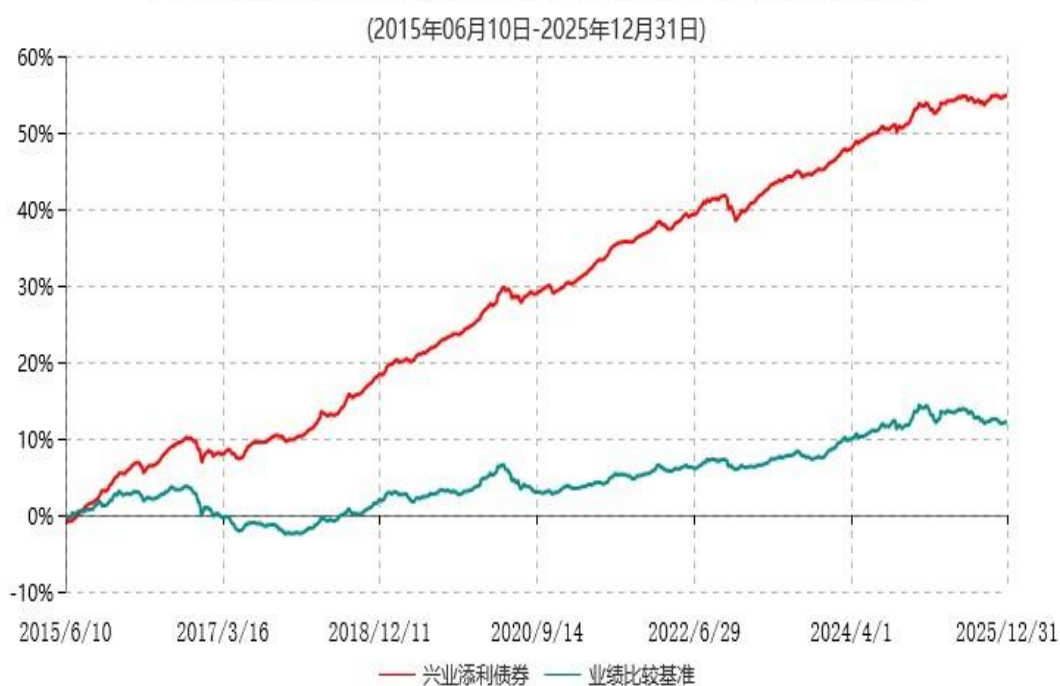
兴业添利债券型证券投资基金累计净值增长率与业绩比较基准收益率历史走势对比图