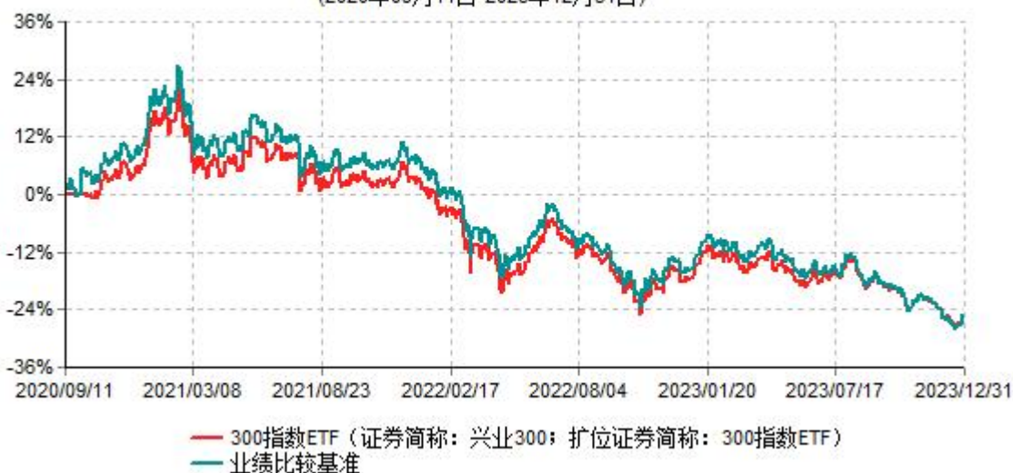
兴业沪深300交易型开放式指数证券投资基金累计净值增长率与业绩比较基准收益率历史走势对比图 (2020年09月11日-2023年12月31日)